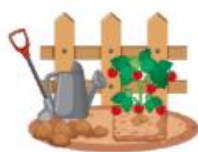
Jardins potagers individuels