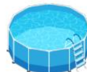
Piscines privées (plus d'1 m 3 )