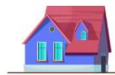
Façades, toitures, et autres surfaces imperméabilisées