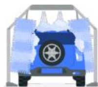
Stations de lavage