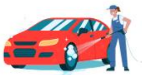
Lavage de véhicules par des particuliers (y compris bateaux de plaisance)